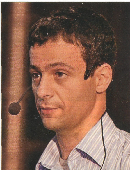
Артем Оганов, кристаллограф-теоретик, предсказывает новые вещества, один из самых цитируемых российских ученых