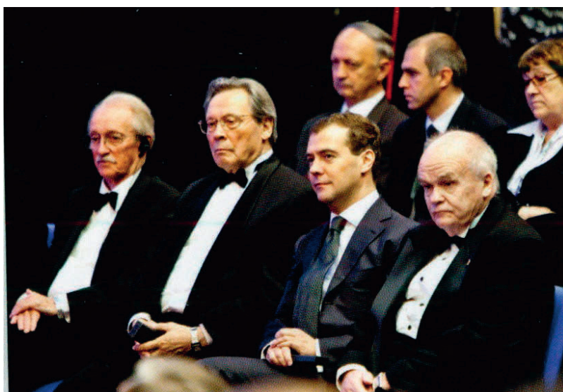
Санкт-Петербург. На церемонии вручения премии «Глобальная энергия» в качестве Председателя наблюдательного совета премии, 2015 год