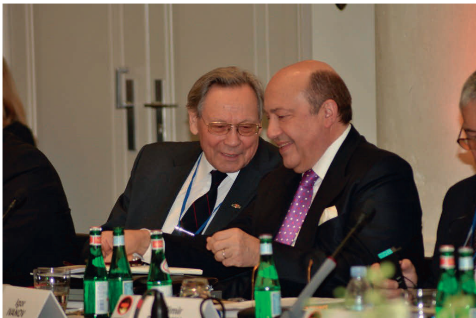
На заседании Люксембургского Форума, международной общественной организации по контролю над ядерным оружием, в качестве члена Наблюдательного совета Форума