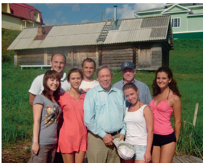
Со студентами, проходящими практику в геобиостационаре «Ротковец»