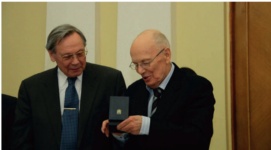
С академиком Б.Е. Патonom, президентом НАН Украины