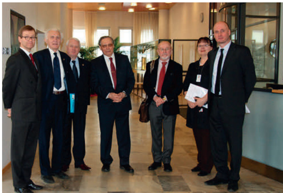
Во время командировки в Финляндию