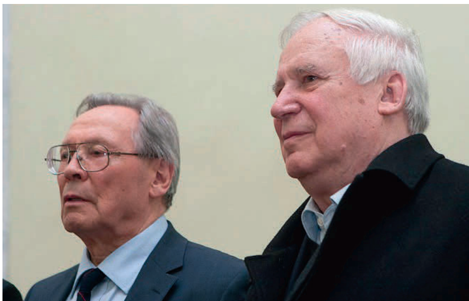
С Н.И. Рыжковым