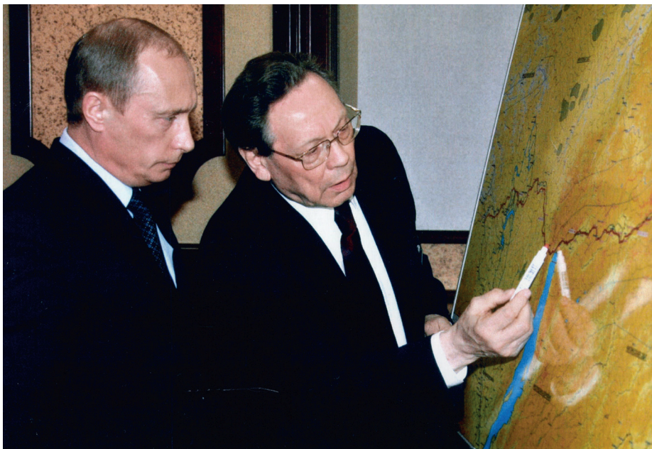
На совещании в Томске по переносу нефтепровода за пределы водосборной зоны Байкала для предотвращения его загрязнения при землетрясении, 2006 год