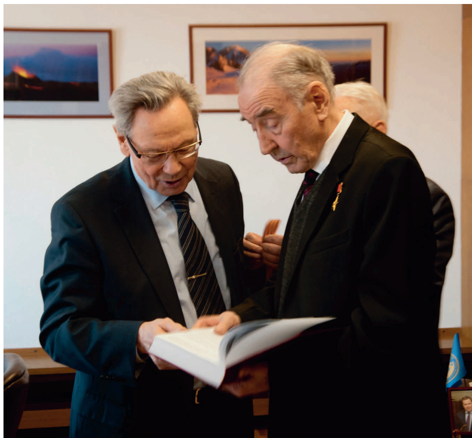
С Президентом НАН Украины академиком Б.Е. Патоном