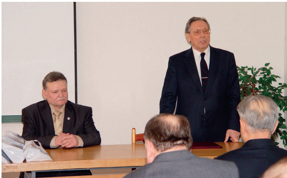
Н.П. Лаверов поздравляет СПП Президиума РАН с 60-летним юбилеем