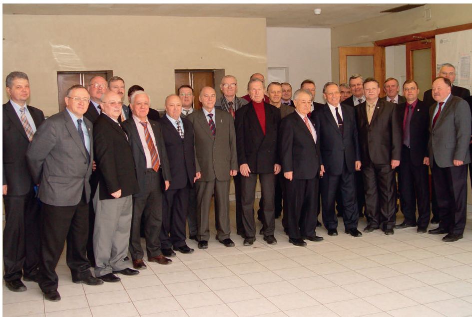
Коллективное фото в СПП Президиума РАН