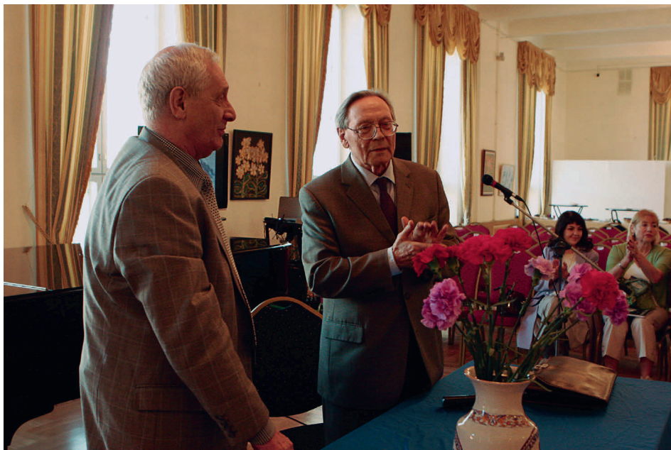
В Архангельске на конференции по проблемам развития Арктики