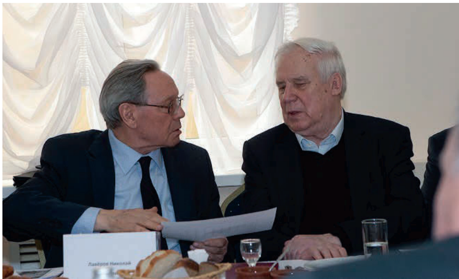
С экс-премьер-министром СССР Н.И. Рыжковым