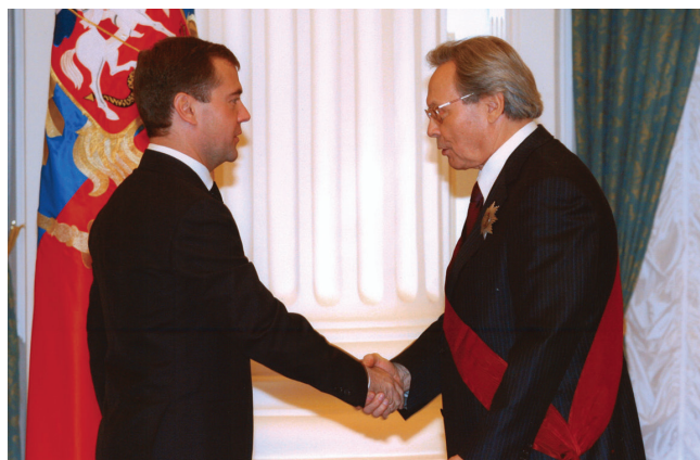
Д.А. Медведев поздрав- ляет с получением ордена «За заслуги перед Отече- ством» I ст., 2009 г.