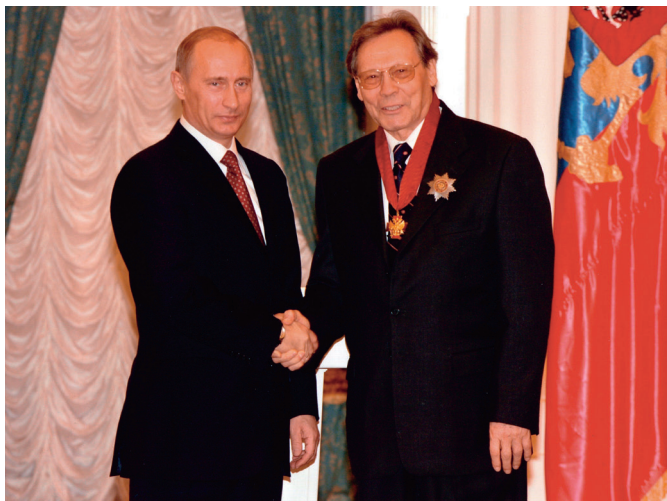
В.В. Путин вручает орден «За заслуги перед Отече- ством» II ст., 2005 г.