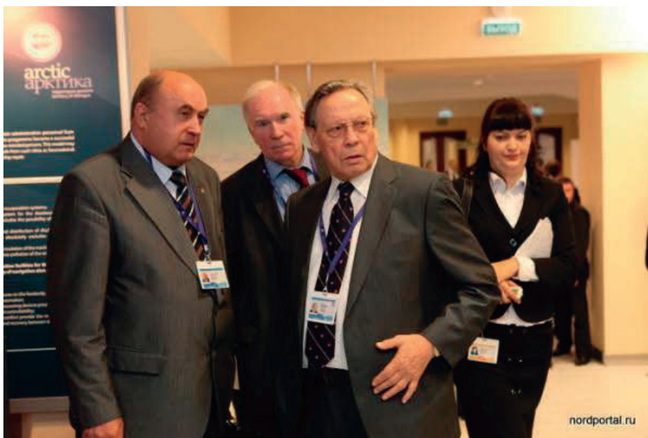
На презентации полного собрания сочинений В.И. Вернадского в Геологическом музее им. В.И. Вернадского