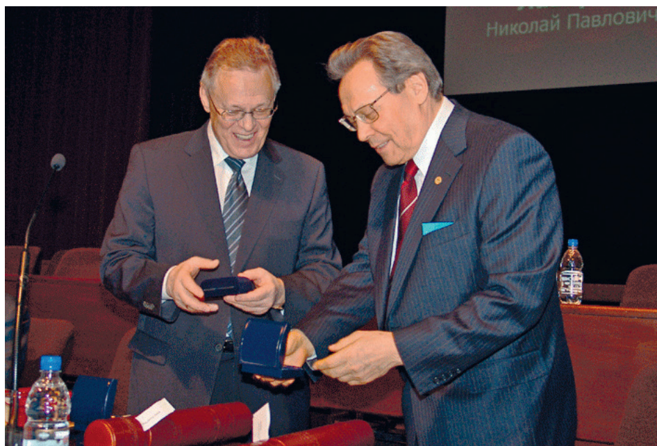
С Президентом РАН академиком Ю.С. Осиповым