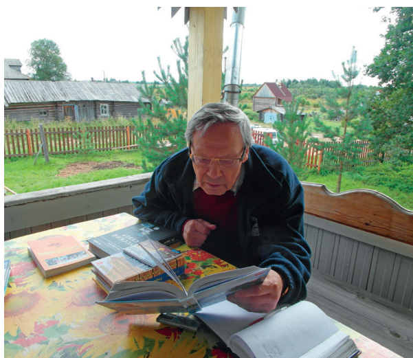
В родном доме в ротковецкой деревне Пожарище