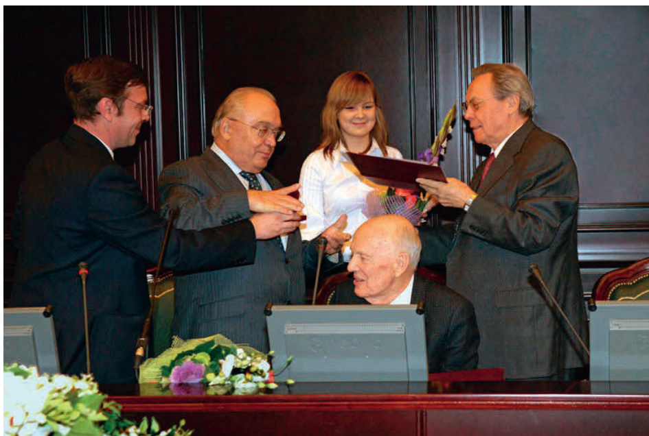
При посещении НАН Украины (сидит академик Б.Е. Патон)