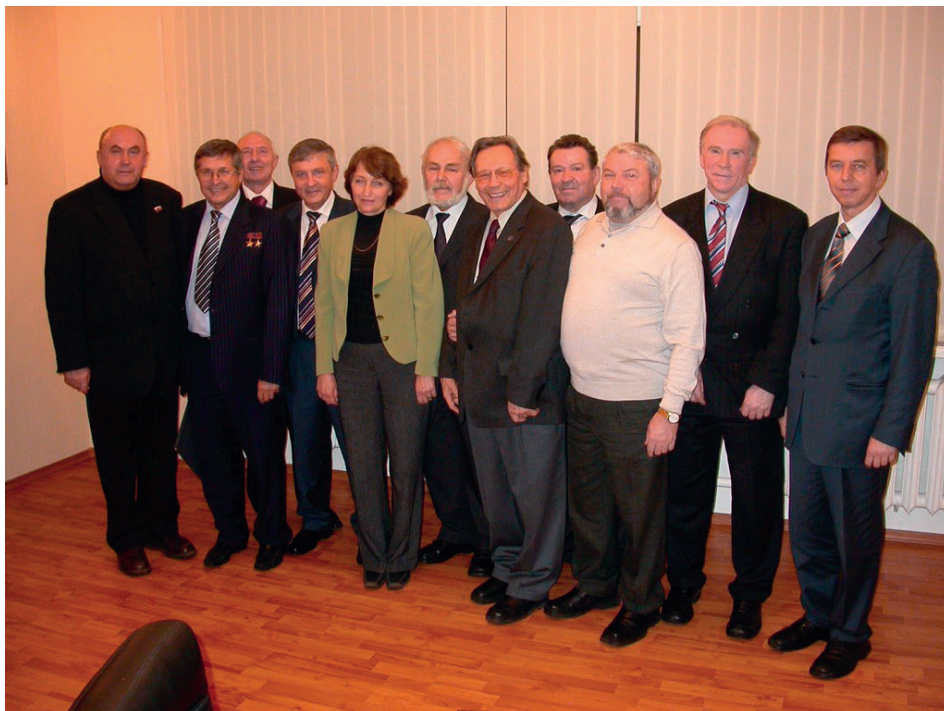
В Архангельске на Ломоносовских чтениях, проводимых Ломоносовским фондом и Архангельским научным центром