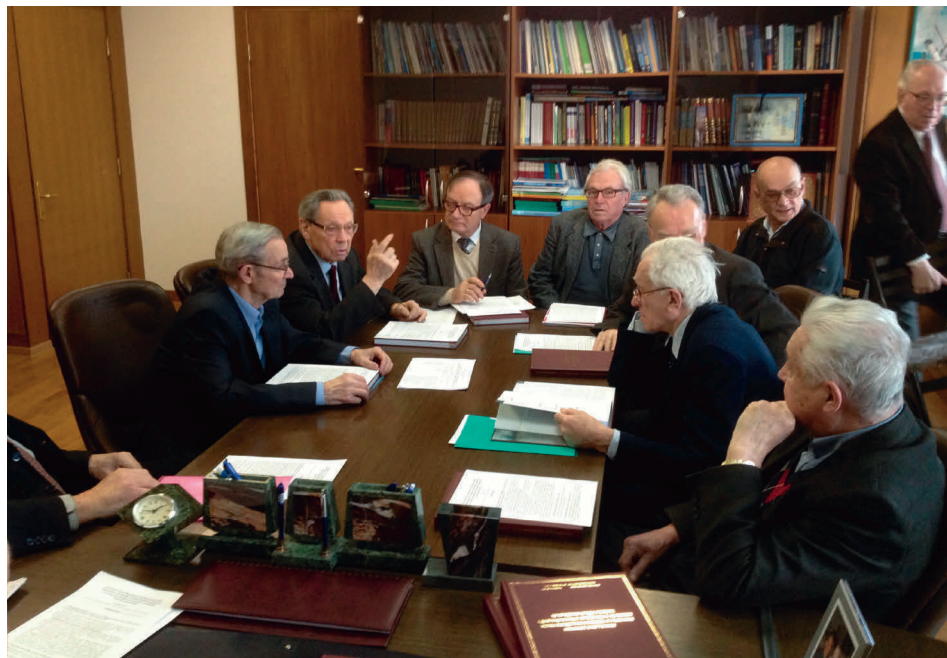
Заседание совета по программе №18 Президиума РАН