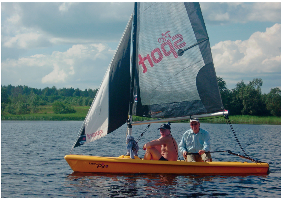
Прогулка на яхте по озеру в родном селе