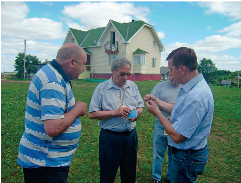
С земляками на фоне здания геобиостационара «Ротковец»