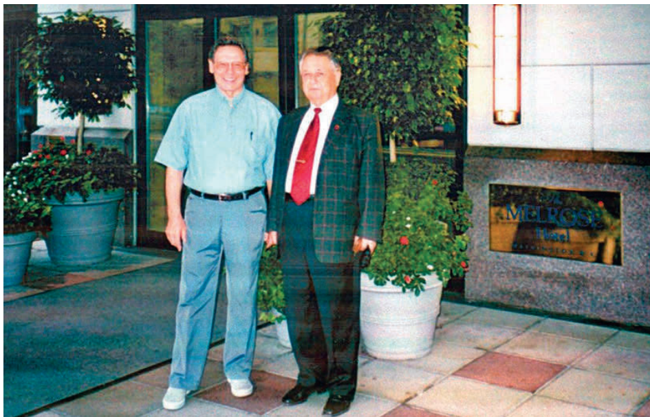
В дни проведения одного из совещаний комитета РАН–НАН США по проблемам нераспространения ядерного оружия. (Слева – председатель постоянного комитета РАН–НАН США вице-президент РАН академик Н.П. Лаверов), Вашингтон, США, 2002 год