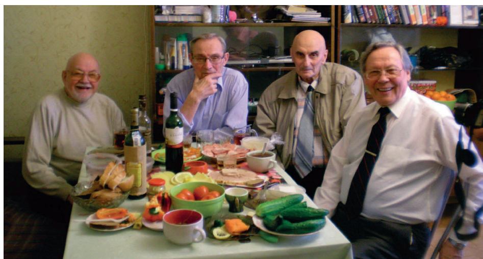
Встреча с сокурсниками в ИГЕМ РАН