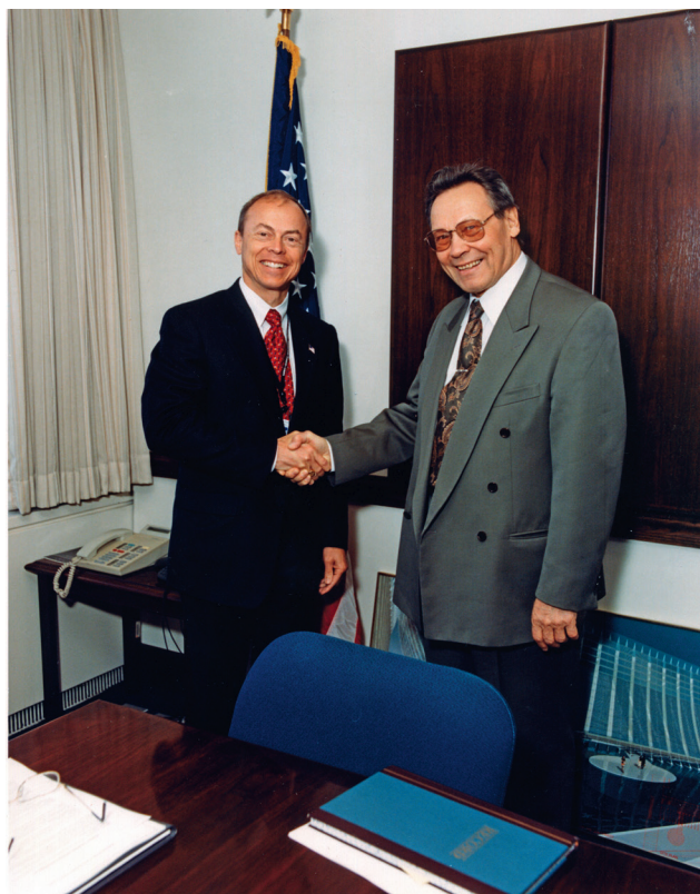
Н.П. Лаверов, иностранный член Национальной инженер- ной академии США