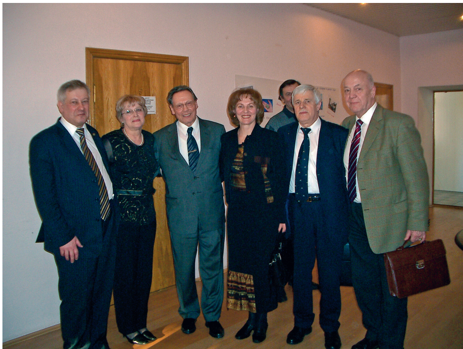
На юбилее академика Н.С. Бортникова в ИГЕМ РАН, март 2006 года