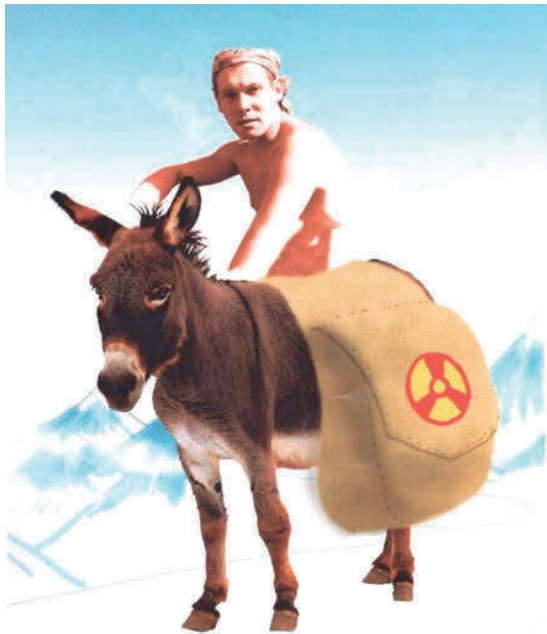
Предпочитая прочим элементам Уран в своём походном рюкзаке, В неблизкий путь до вице-президента Он стартовал на этом ишаке...