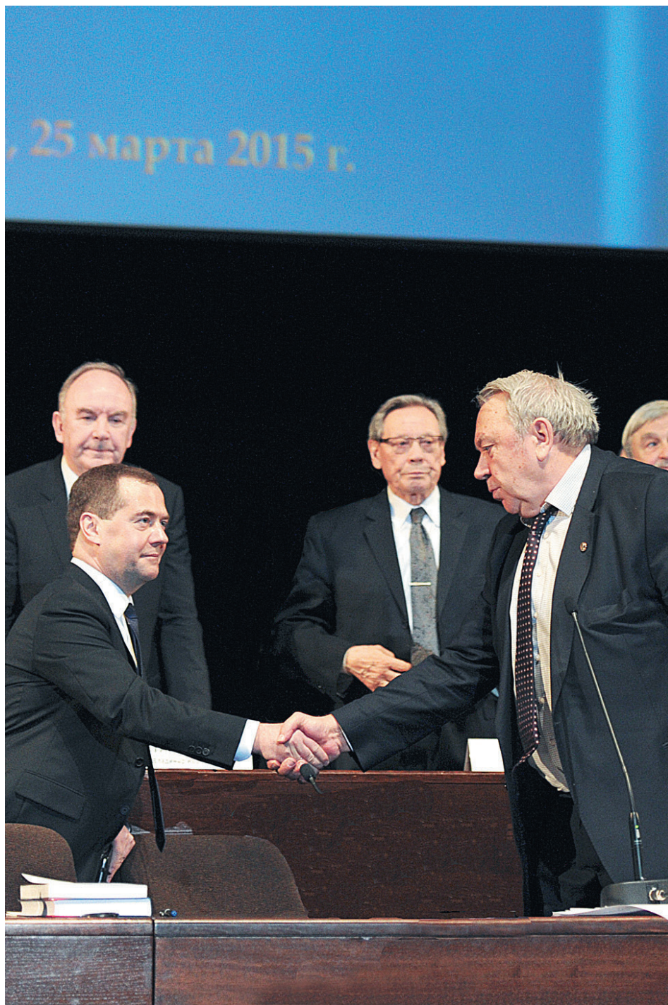
На общем собрании РАН 2015 года. Научная сессия посвящена Арктике