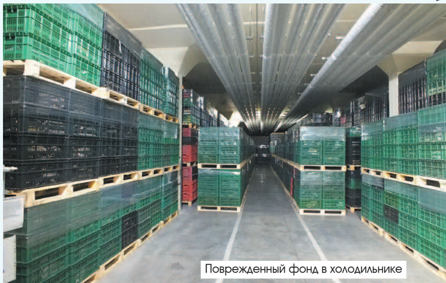
Поврежденный фонд в холодильнике

Наверное, ИНИОН можно считать лидером по числу смен руководителей. Сейчас нам переназначили уже четвертого (!) с 2015 года временного исполняющего обязанности директора. Два раза отменяли уже начав